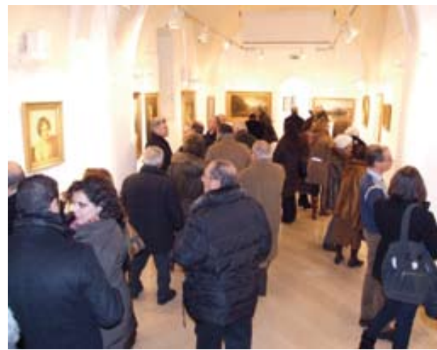
Mostra appena inaugurata.

La mostra è passata ma restano, come segno concreto, il catalogo e l'impegno nella promozione dell'Arte e della Cultura e di iniziative di grande valore sociale, che sono i compiti statutari della Fondazione Banca del Monte "Domenico Siniscalco Ceci" di Foggia.