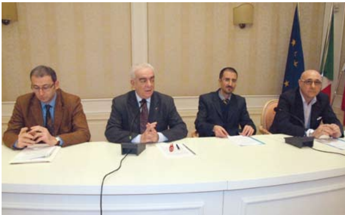
La presentazione dell'iniziativa nella Sala "Rosa del Vento" della Fondazione Banca del Monte.

3.5 I soggetti selezionati vengono successivamente segnalati a Banca Etica per l'attività di istruttoria, fornendo alla banca stessa almeno la seguente documentazione: a) descrizione del progetto di impresa o dell'investimento per cui viene richiesto