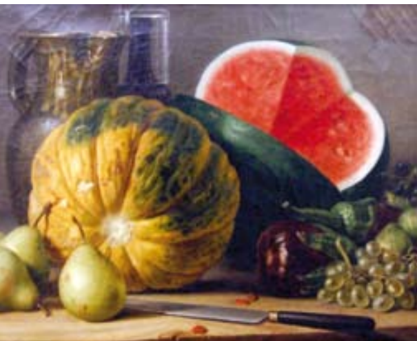
Domenico Caldara, Natura morta.

Durante la presentazione, il Presidente della Fondazione, avv. Francesco Andretta, ha annunciato una novità nella "politica" della Fondazione Banca del Monte: "Oggi, per la prima volta, un catalogo di una mostra da noi organizzata viene messo in vendita e non distribuito gratuitamente. Il prezzo di 15 euro, peraltro, è risibile in proporzione alla qualità dei contenuti, alle numerose illustrazioni a colori, al pregio grafico e dei materiali. È un modo per rientrare, anche se in misura minima, delle spese sostenute per la stampa e avere a disposizione fondi